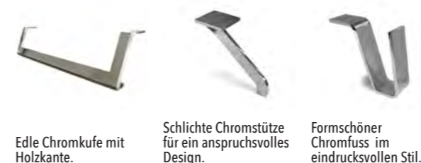
Edle Chromkufe mit Holzkante.