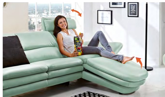
Longchair Vital mit zweimotorischer Verstellmöglichkeit.