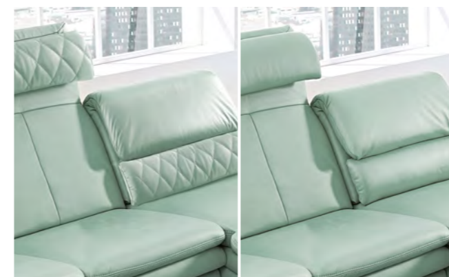
Vorgesetztes Kissen wahlweise mit und ohne Rautensteppung erhältlich.