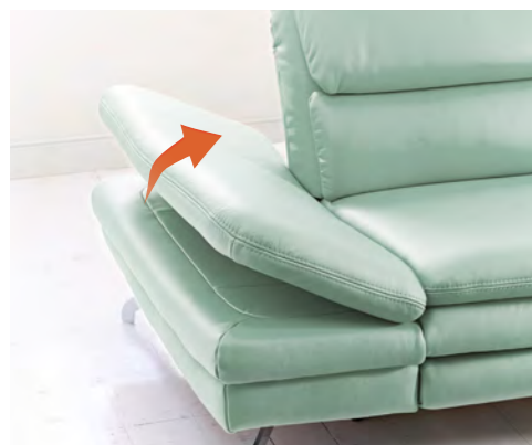
Klappbare Armauflage für Ihre individuelle Sitzposition.