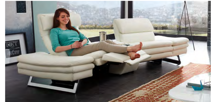
Gemütliche TV-Funktion mit motorischer Verstellung und extra langem Fußteil.