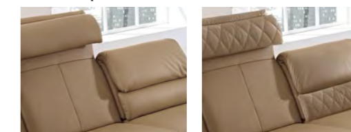
ohne Rautensteppung MONDO EASYLINE 3851