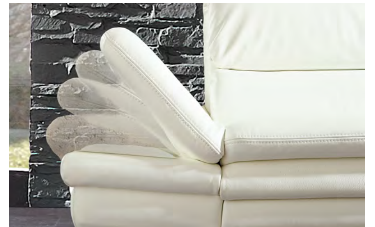
Armauflage stufenweise neigbar.

POLSTERKOMBINATION 3851 bestehend aus 1,5 Sitzler mit TV-Funktion, Trapezelement und 1,5 Sitzler mit TV-Funktion, B/H/T 274/80(108)/160 cm. SOFA 3851 bestehend aus 2 Sitzler, B/H/T 190/80(108)/98 cm und TV-SESSEL TRIPOLIS 2264 im Bezug Leder Bolero bianco, B/H/T 64/110/85 cm.